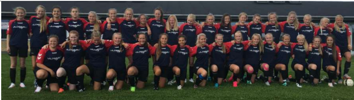
J14 på Vildbjerg cup 2016

Innledende kamper: Minimum 4-5 lag i hver pulje, hvor alle spiller mot alle. Nr. 1 og 2 i hver pulje går videre til sluttspillet, som avvikles etter cupsystemet. Øvrige lag i puljene går videre i DOMINUS CUP, som avvikles etter cupsystemet. Alle lag er derfor garanterte minimum 4 kamper.