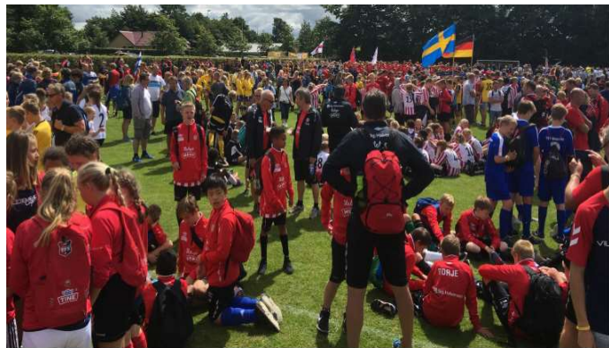
VBK spillere på Vildbjerg