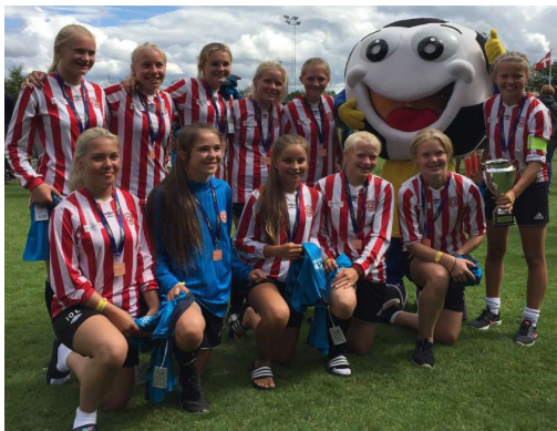
J14 på Vildbjerg cup 2016