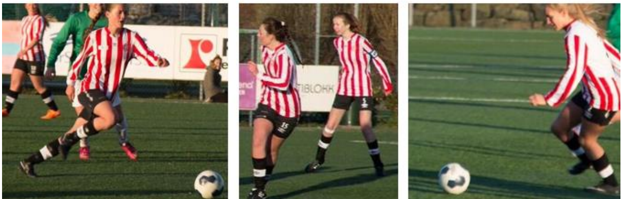
Fra første seriekampen i dameserien 2016