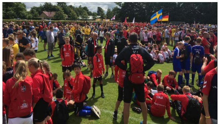
VBK spillere på Vildbjerg