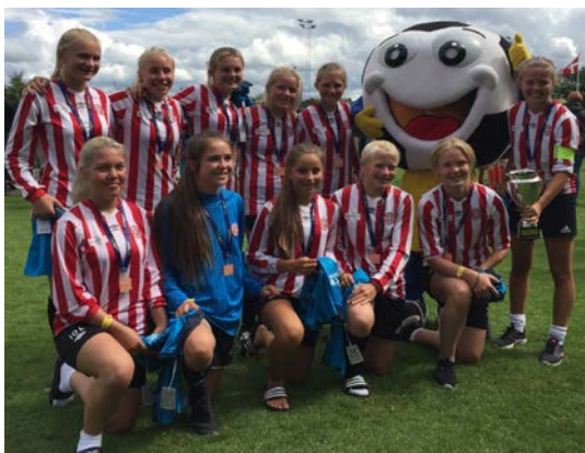
J14 på Vildbjerg cup 2016