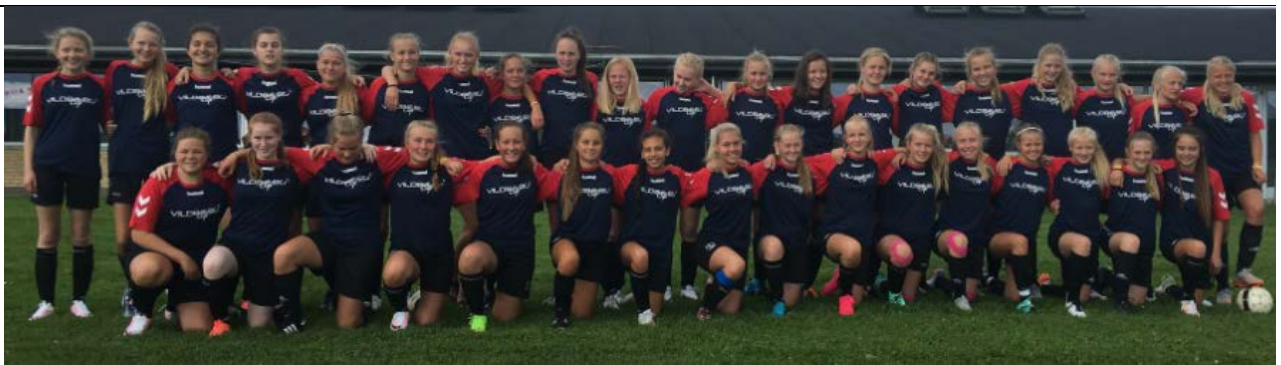
J14 på Vildbjerg cup 2016

Innledende kamper: Minimum 4-5 lag i hver pulje, hvor alle spiller mot alle. Nr. 1 og 2 i hver pulje går videre til sluttspillet, som avvikles etter cupsystemet. Øvrige lag i puljene går videre i DOMINUS CUP, som avvikles etter cupsystemet. Alle lag er derfor garanterte minimum 4 kamper.