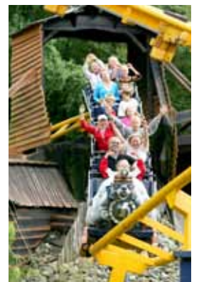
I Kongeparken får alle deltakere spesialpris.

På www.RegionStavanger.com finner du oppdatert informasjon om overnatting og opplevelser i Stavanger og omegn.